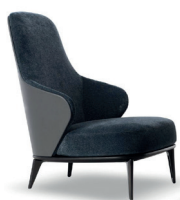
9 LESLIE BERGÈRE CM 68X94 H100