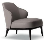
8 LESLIE POLTRONA CM 68X86 H74